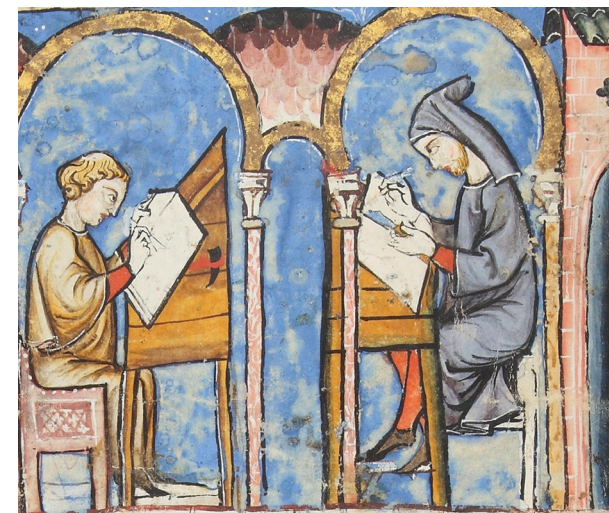
Patrimonio Nacional. Real Biblioteca del Monasterio de El Escorial, RBME T-1-6